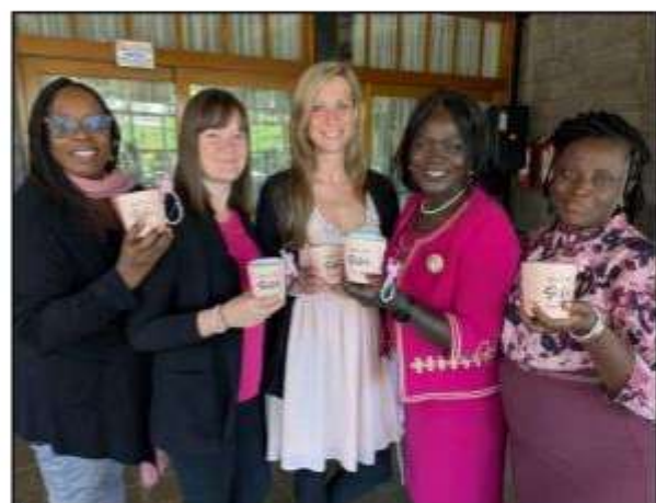
Wir feiern, SfH ist endlich offiziell eine NGO