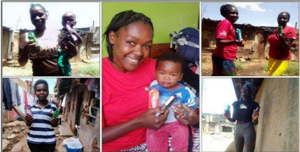
Eine Auswahl der entstandenen Fotos vom International Women's Day

Am selben Tag erhielten wir das letzte Dokument, das wir benötigten, um ein kenianisches Bankkonto für die Sisters for Hope zu eröffnen. Diese Möglichkeit ergibt sich erst jetzt, nachdem wir unser offizielles NGO-Zertifikat erhalten haben. Wir konnten nun alle erforderlichen Dokumente einreichen und hoffen auf eine baldige Bestätigung. Mit diesem Konto können wir nicht nur Spenden aus Europa empfangen, sondern auch lokale Spenden sammeln und somit unsere finanzielle Basis erweitern.