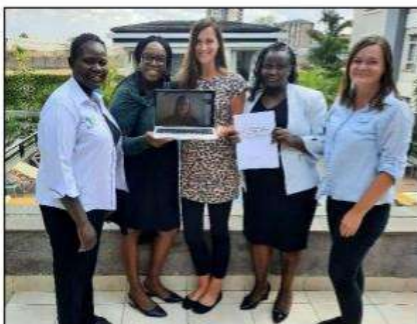
Unser 1. SfH Leitungstreffen

Obwohl wir bereits vor der offiziellen Gründung unserer NGO umfassend tätig waren und es auch legal sein durften, eröffnen sich nun neue Wege und Möglichkeiten, die uns bisher nicht zur Verfügung standen. In naher Zukunft werden wir ein neues Projekt starten, das wir euch noch vorstellen werden. Ihr habt allen Grund, gespannt zu sein!